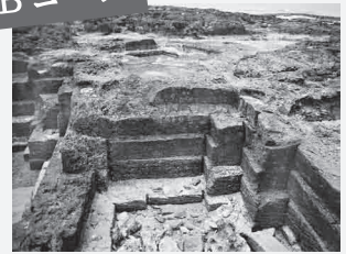
石切場見学 + グラスボート見学